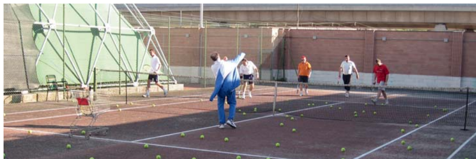
La lezione è finita, tutti a raccogliere le palline.