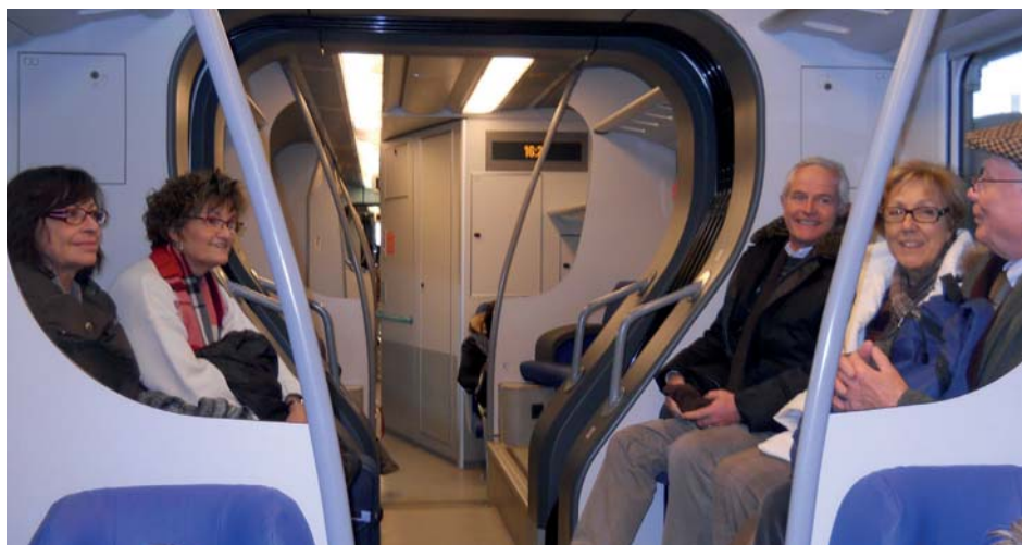
Verso Padova a bordo di un minuetto

Per questo scegliamo di fare gite più brevi e quindi meno costose mantenendo sempre lo stile che ci ha contraddistinto finora, cercando di visitare le mostre importanti che continuamente vengono inaugurate, le città artistiche e il paesaggio. Abbiamo già effettuato una gita (udite udite) in treno e devo dire che è stata piacevole. Abbiamo visitato