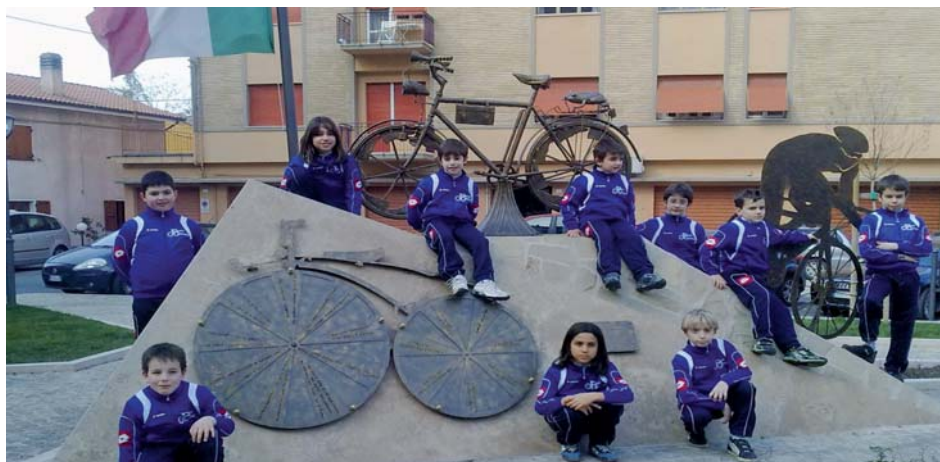
Chiaravalle, monumento alla bicicletta.