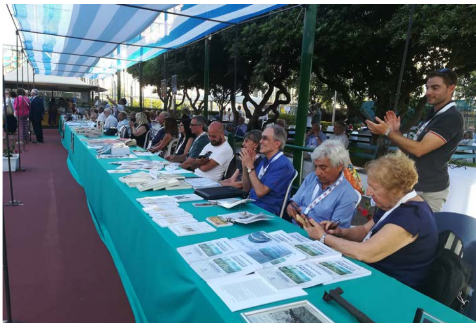
Tavolo degli autori.

Tuttavia una gara doveva pur esserci e si doveva scegliere tra le circa cento opere presentate. La giuria, composta da membri del Book Club DLF Salerno, dapprima ha selezionato 15 opere, e nella serata conclusiva ha designato i vincitori, divi-