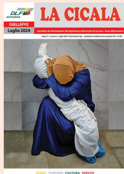
In copertina "Pietà di Gaza" foto di Alejandro Cegarra, vincitore del World Press Photo 2024.