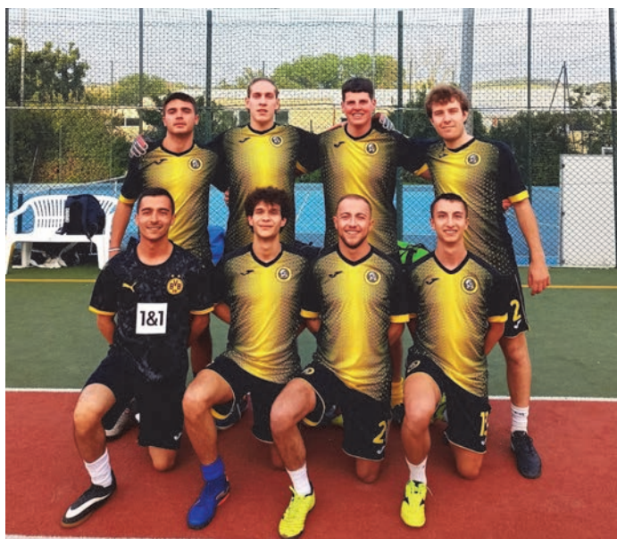
Squadra di calcetto.

Il merito del successo è anche dei volontari dell'ASD che ringrazio sinceramente.