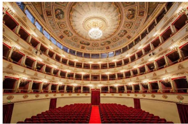
Teatro Pergolesi di Jesi

NORMA 20 luglio LA BOHEME 27 luglio TURANDOT 3 agosto CARMINA BURANA 8 agosto