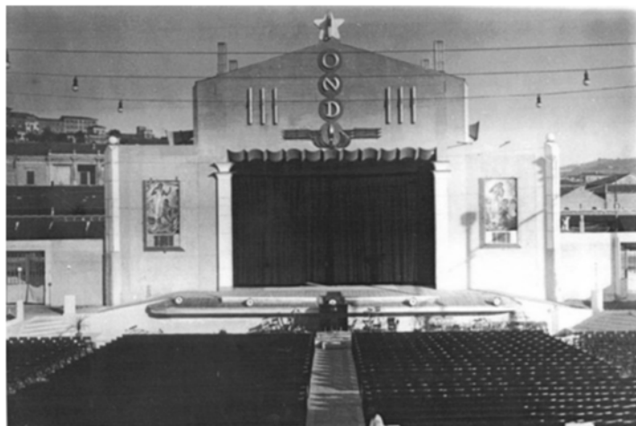
Arena Stamira del Dopolavoro Ferroviario di Ancona nel 1934.

La scelta orchestra del « Dopo Lavoro Ferroviario » oltre agli inni della Patria, svolgerà il seguente programma: