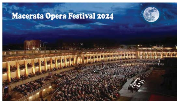
Sferisterio di Macerata

1. - Sinfonia « Barbiere di Siviglia » Rossini — 2. Sinfonia « Norma », Bellini — 3. Intermzzo « Cavalleria Rusticana » Mascagni — 4. Marcia nuziale di Mendelssohn.