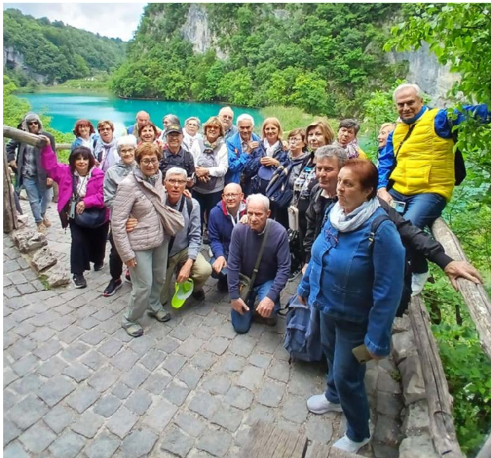
I turisti del DLF ai laghi di Plitvice.

ta, grazie anche ai miei compagni del DLF con i quali ogni giorno condivido la presenza e sanno darmi consigli preziosi, grazie infine a Esitur per la indispensabile collaborazione tecnica.