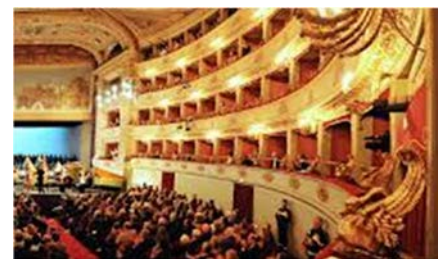
Teatro Pergolesi di Jesi.

Questi eventi si inseriscono nella politica del Dopolavoro Ferroviario di promuovere la cultura e la socialità, offrendo ai soci l'opportunità di godere di spettacoli di alta qualità in un ambiente conviviale. L'associazione, che ha una lunga storia di attività culturali e ricreative, è impegnata a far conoscere l'opera e a renderla accessibile a tutti, anche attraverso iniziative di sensibilizzazione e di educazione musicale.