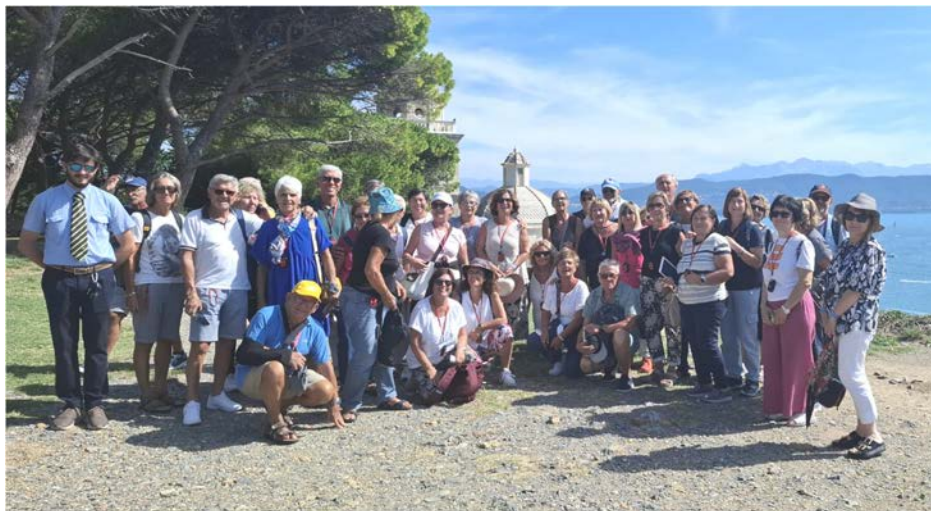
Gita sul lago Maggiore

Il settore Turismo ha ormai il suo "zoccolo duro", tanti soci che partecipano continuativamente alle nostre iniziative, segno che le gradiscono,