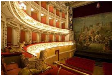
Teatro della Fortuna di Fano

Dopo la stagione operistica estiva allo Sferisterio di Macerata, il Dopolavoro Ferroviario propone due nuove date: il 19 dicembre, La Bohème di Puccini che sarà rappresentata al Pergolesi di