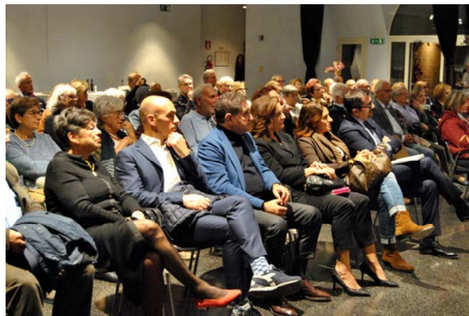
Il salone delle feste gremito.

L'anno prossimo, il 2026, ricorrono i 100 anni del Dopolavoro Ferroviario di Ancona. Abbiamo in animo di organizzare una serie di eventi, sportivi, culturali, solidali e logistici, con lo stesso spirito con cui abbiamo celebrato i 100 anni del Nazionale.